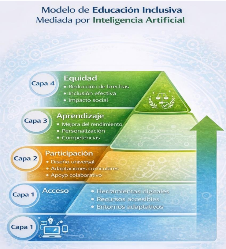
Figura 11. “Modelo de educación inclusiva mediada por inteligencia artificial”.

clave en la interpretación y adaptación de las herramientas disponibles.