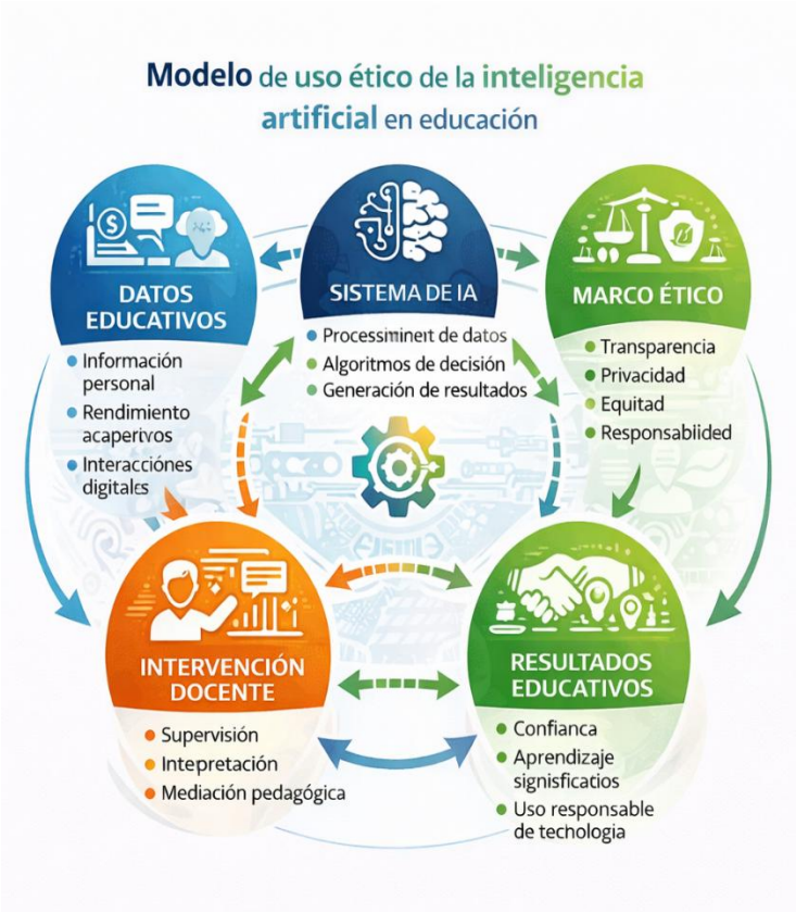
“Modelo de uso ético de la inteligencia artificial en educación”.