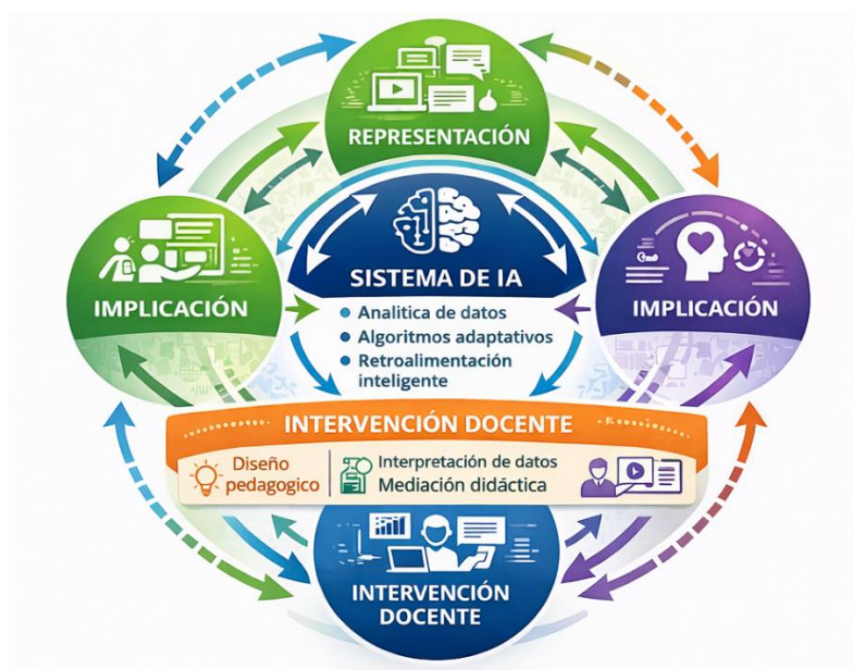
Figura 3. “Modelo integrador IA–DUA en entornos de aprendizaje”.