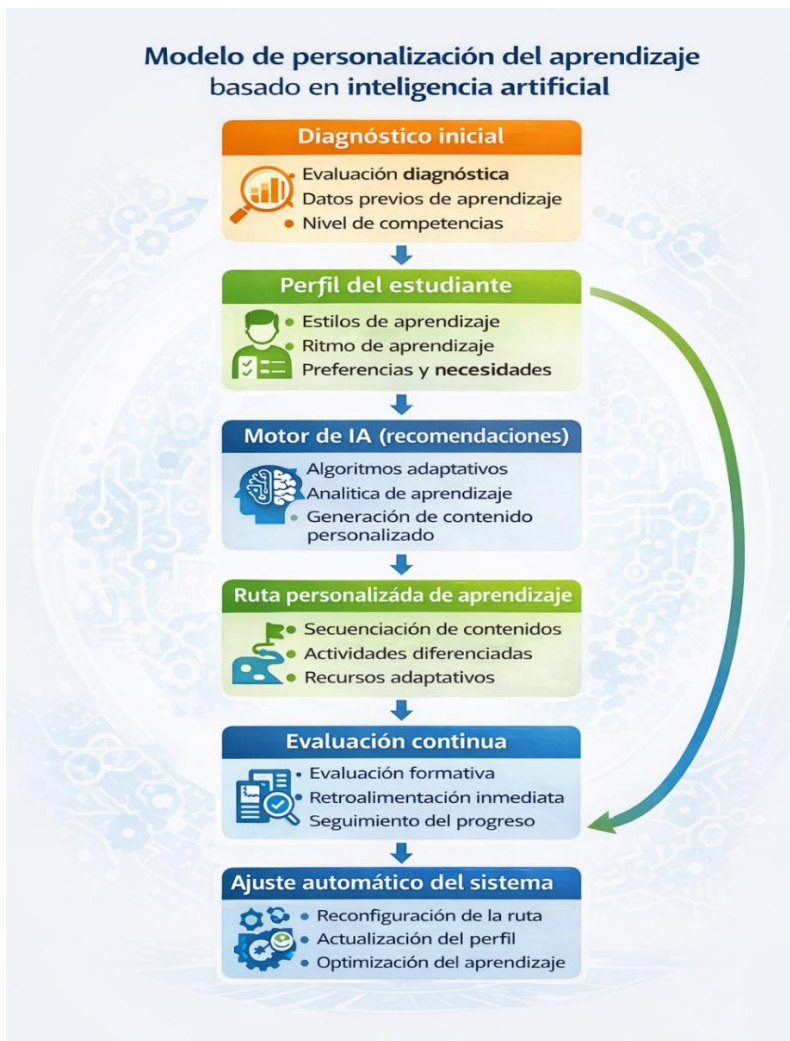
Figura 7. “Modelo de personalización del aprendizaje mediante inteligencia artificial”.