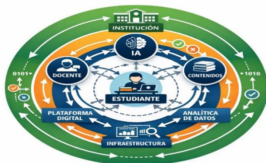
Figura 1. Modelo sistémico de inteligencia artificial en educación